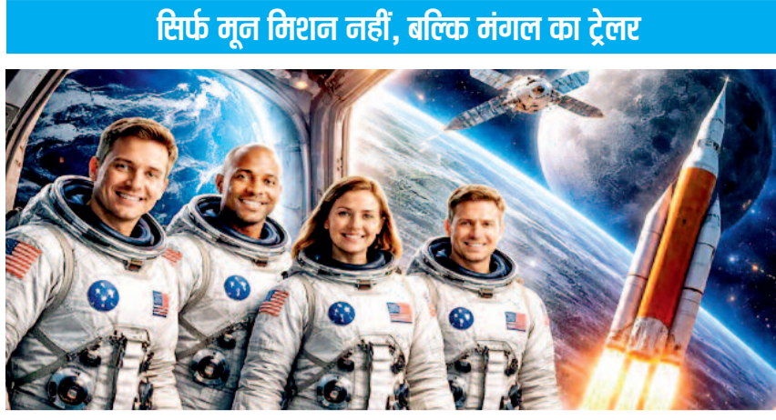
सिर्फ मून मिशन नहीं, बल्कि मंगल का ट्रेलर

नासा ने आर्टेमिस-2 मिशन के लिए 4 एस्ट्रोनाट्स का चयन किया है। इसमें मिशन कर्प्टन कर्मांडर रीड वाइसमैन हैं। वहीं, चांद की ओर जाने वाले पहले अश्वेत व्यक्ति विक्टर ग्लोवर इस मिशन के पायलट हैं। इसके साथ ही मिशन स्पेशलिस्ट क्रिस्टीना कोच हैं, जो चांद की दहलीज पर पहुंचने वाली पहली महिला होंगी। साथ ही जेरेमी हेनसन इस मिशन का हिस्सा बनने वाले पहले अंतरराष्ट्रीय यात्री हैं।